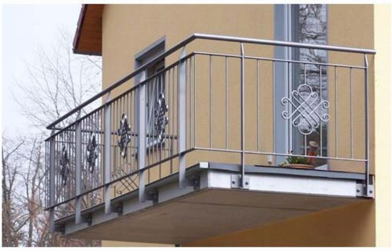
06 Balkongeländer aus feuerverzinktem Stahl, lackiert, mit Edelstahlhandlauf

Schmiedeeisernes Balkongeländer aus feuerverzinktem Stahl, lackiert, mit Bauchstäben und barocken Zierelementen