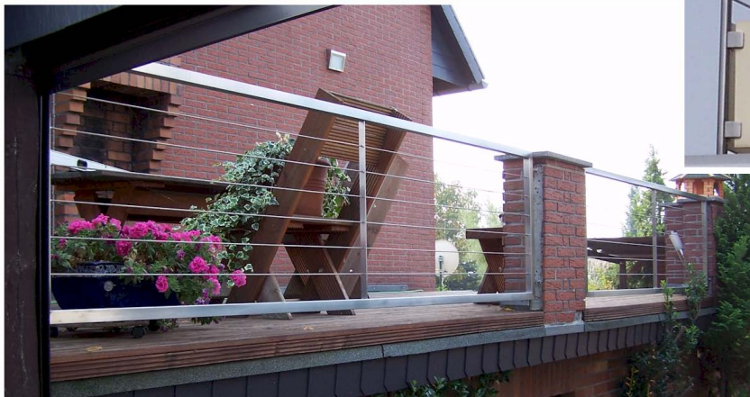
05 Geländerfelder komplett Edelstahl mit Füllung aus horizontalen Edelstahlseilen