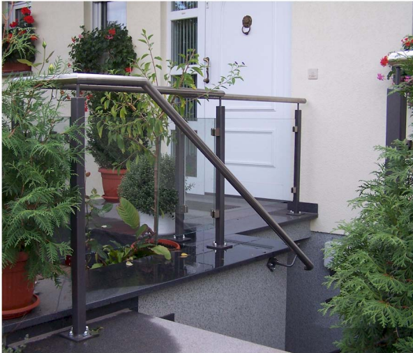
01 Edelstahlhandlauf, Stützen aus feuerverzinktem Stahl, lackiert, Sicherheitsverglasung mit Einzelglashaltern