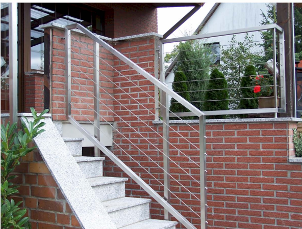
03 Edelstahl-Treppengeländer mit Füllung aus Edelstahlseilen

Die Geländer werden mit unterschiedlichen Ausführungen und Materialien gefertigt. Ganz nach Ihrem Geschmack können wir Ihnen die passende Lösung fertigen.