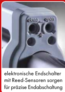
elektronische Endschalter mit Reed-Sensoren sorgen für präzise Endabschaltung