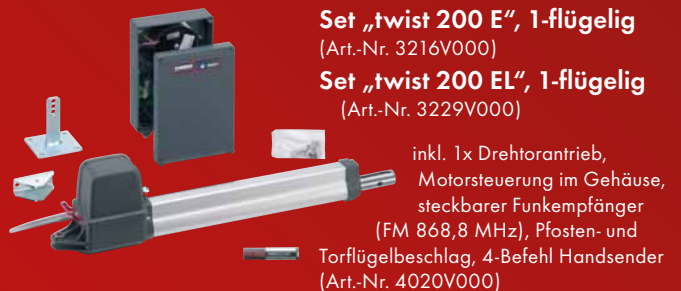
Set „twist 200 E“, 1-flügelig (Art.-Nr. 3216V000)