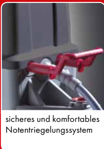
sicheres und komfortables Notentriegelungssystem