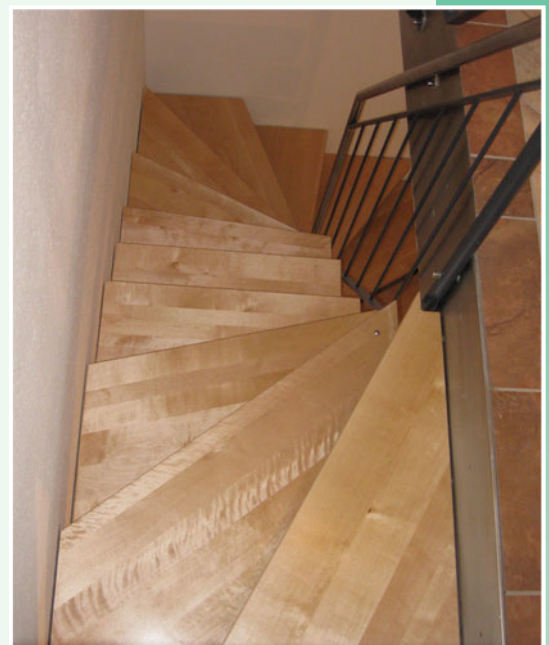
03 Wandholmtreppe von oben