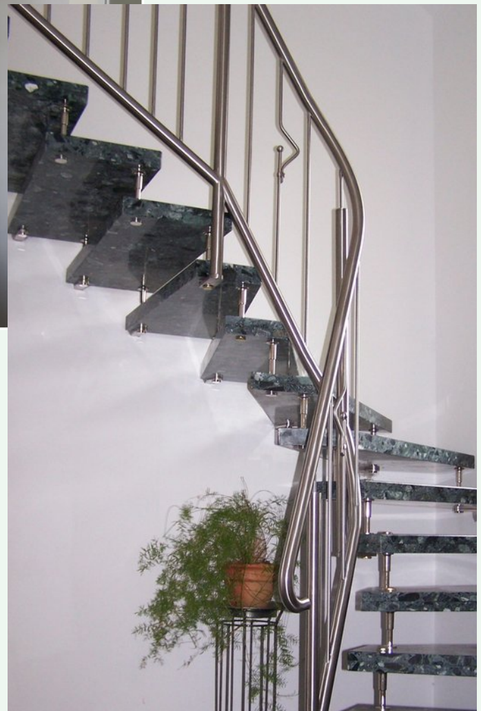
06 Edelstahlgeländer an System-Bolzentreppe