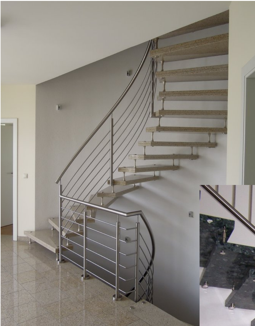
05 Edelstahl-Reeling-Geländer an System-Bolzentreppe

Wir fertigen individuelle Geländer aus Edelstahl für Ihre bestehende Bolzentreppe.