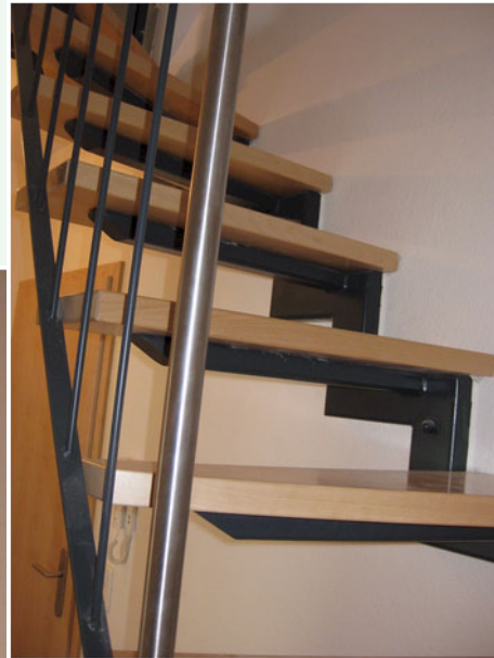
01 Der tragende Wandholm wird an einer massiven Wand befestigt

Gerade in engen Fluren wird der nutzbare Gehbereich durch die Bauhöhe der Treppenholme bei einer herkömmlichen Zweiholmtreppe eingeschränkt.