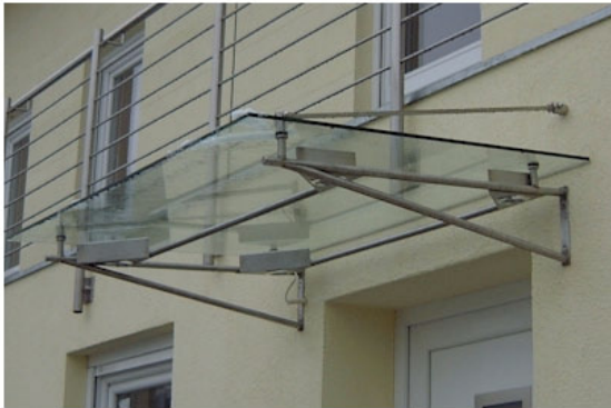
08 Ganzglasvordach mit Edelstahlzugstreben und Auflagerkonsolen