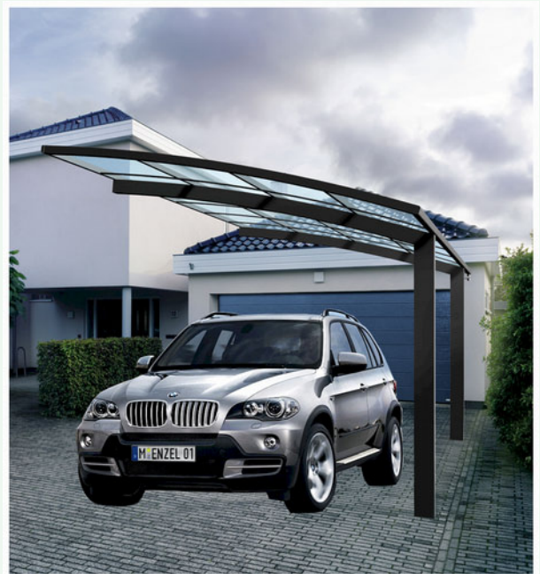
11 Carport als Stahlkonstruktion mit Acryldeckung

Seit 25 Jahren planen, gestalten und bauen wir Vordächer und Stahlkonstruktionen in solider handwerklicher Arbeit und Zuverlässigkeit. Durch diese langjährige Erfahrung fertigen wie Ihnen Ihr Wunschvordach als Unikat und passen dieses optimal an Ihre Situation an.