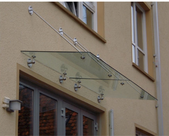
09 Ganzglasvordach mit Edelstahlzugstreben