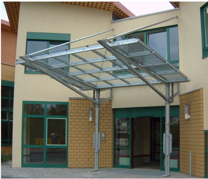
07 Stahl-/Glasvordach feuerverzinkt